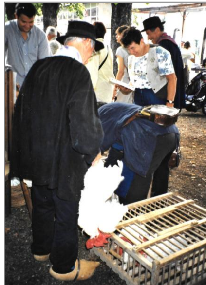
Foire à l'Ancienne à Coligny (Ain) en août 2001

Pendant que les hommes allaient dételer les voitures au fond du marché et emmenaient leurs chevaux à l'écurie, les femmes restaient pour vendre leurs produits, ce qui représentait l'argent pour l'entretien du ménage.