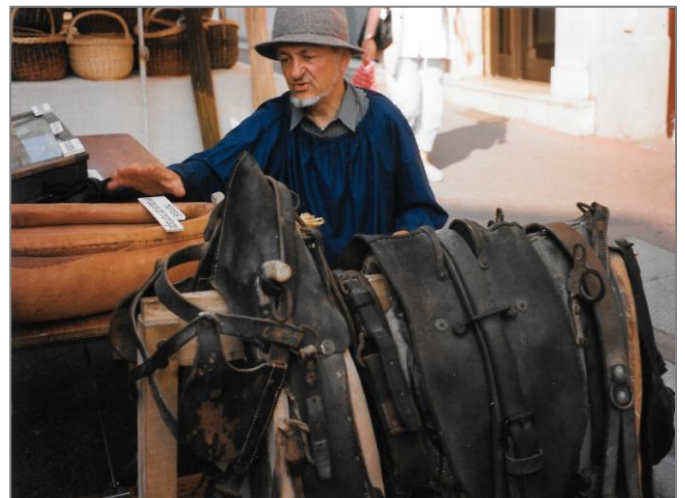
Reconstitution d'un marché en juillet 1995 à Bourg-en-Bresse (Ain)