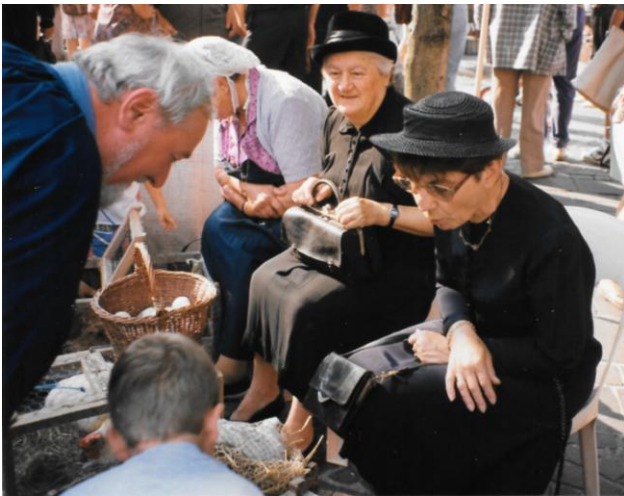
Lors de la célébration du centenaire de la percée de l'Avenue Alsace Lorraine à Bourg-en-Bresse (Ain) en juillet 1995

Pèdè que léj'oumou alôvon dépaye le vatezhe u fon du marsha pi èmenôvon jo shevô a l'étyuzhi, le fene réstôvon pe vèdre jo marshèdi, che que reprezètôve lé seu pe l'ètretin du minnazhou.